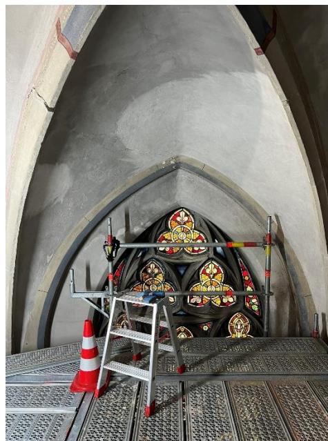
Reinigung im stark verrußten Orgelbereich