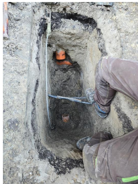
Reparieren der Leckage durch Blitzschutz im Innenhof