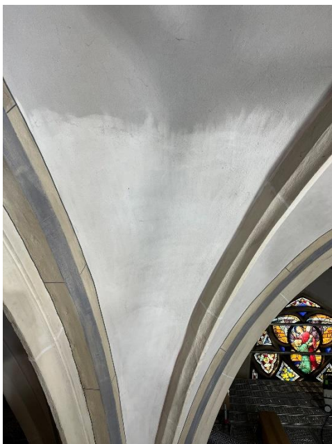
Reinigung der unteren Gewölbefläche