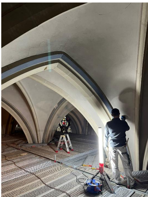
Arbeiten im Gewölbe mit Schwämmen