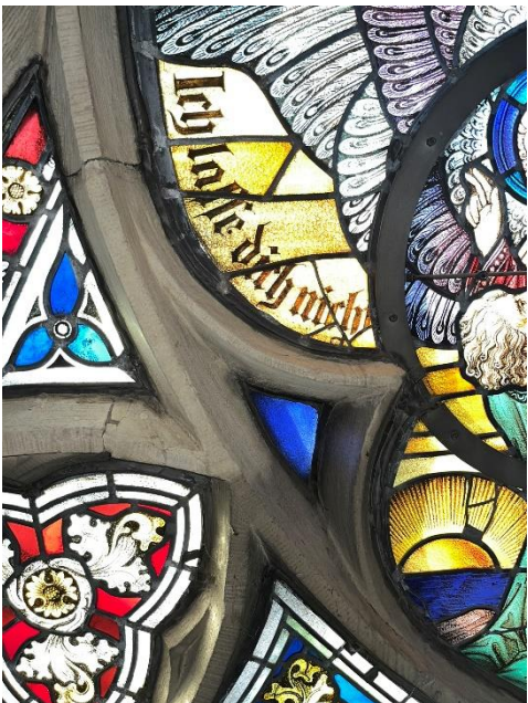
Unterschied von gereinigtem und ungereinigtem Sandstein