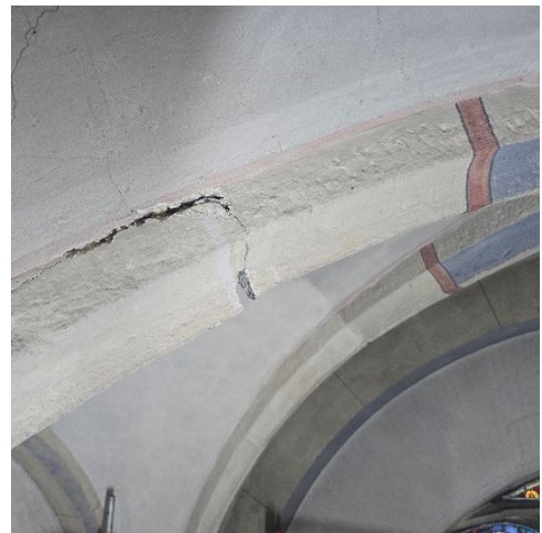
Risse und Abplatzungen im Sandstein und Putz