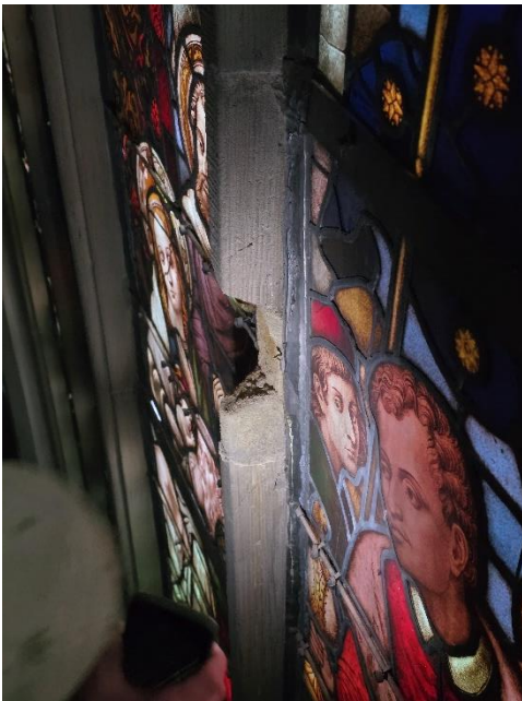
Schaden im Sandstein-Fensterrahmen