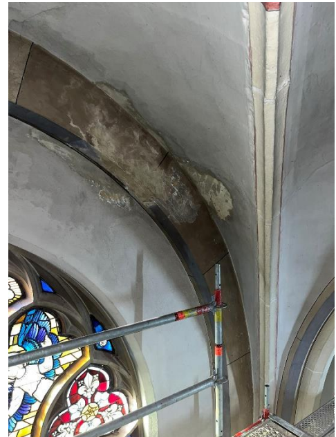
Wasserschäden am Putz